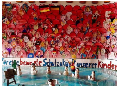
2. Platz Gruppe 4 (2018)