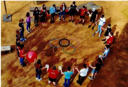
1. Platz Gruppe 4 (2018)

Für die Gruppe 4 (Stufen 7 bis 10): Fotografische Auseinandersetzung mit der Thematik Olympischer und Paralympischer Spiele unter besonderer Berücksichtigung der Leitthematik „Sport verbindet“. Die Papierbilder sind in der Größe 20 x 30 cm, Hochglanz und ohne Rahmen, einzureichen. Bild-Dateien sind erst auf Nachfrage durch den Ausrichter einzusenden. Das Farbspektrum ist freigestellt. Eine Veröffentlichung der ersten Plätze auf unserer Homepage , in unserem Online-Magazin OLYMPISCHES FEUER und in unseren Online-Medien ist (vollständig oder in Ausschnitten) avisiert.