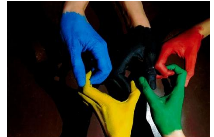
3. Platz Gruppe 4 (2018)

Für die Gruppe 5 (Stufen 11 bis 13): Bearbeitung und Diskussion zu den Olympischen und Paralympischen Spielen 2020 in Tokio im Rahmen eines Diskussionspapiers, das sich kritisch mit der Austragung der Olympischen Spiele und der Außendarstellung der Olympischen Werte in Zeiten einer Pandemie auseinandersetzt. Der Umfang des zu erstellenden Diskussionspapiers soll dabei den Umfang von 10 Seiten DIN A4 (einseitig bedruckt, Schriftgröße 12) nicht überschreiten. Eine Veröffentlichung des ersten Platzes auf unserer Homepage , in unserem Online-Magazin OLYMPISCHES FEUER und in unseren Online-Medien ist (vollständig oder in Ausschnitten) avisiert.