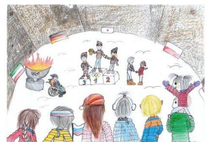
1. Platz Gruppe 3 (2018)