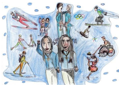
1. Platz Gruppe 2 (2018)